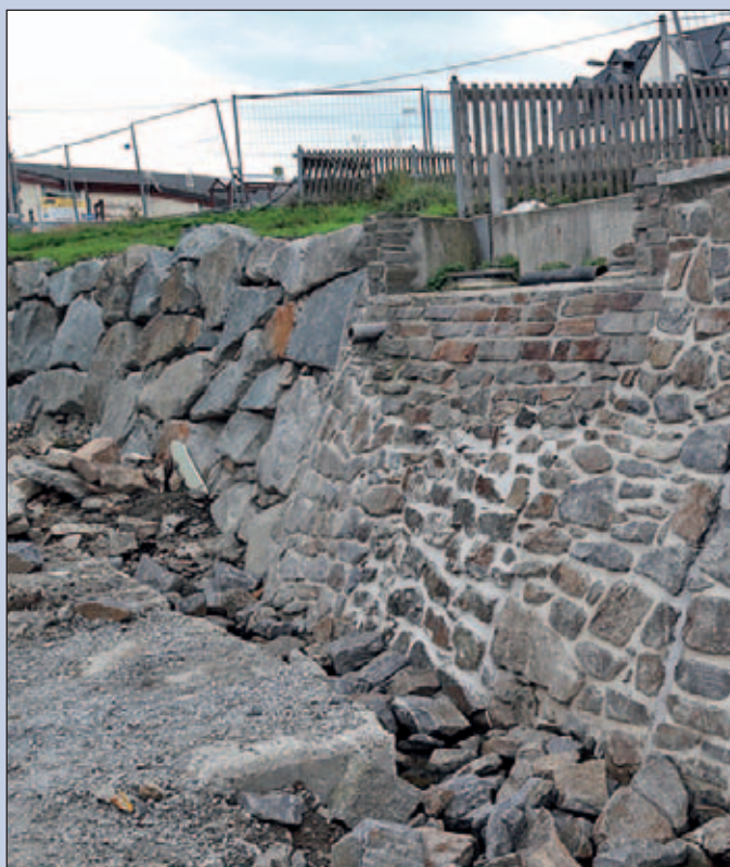
Sanierung Widerlager Fußgängerbrücke am Sägewerk in Mulda