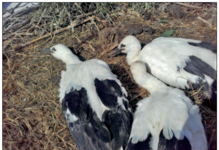
Blick in den Storchhorst zu den diesjährigen 3 Jungstörchen / Schornstein bei BÖCHEX