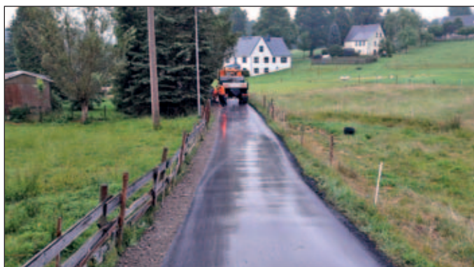
Zufahrt Zethau 168