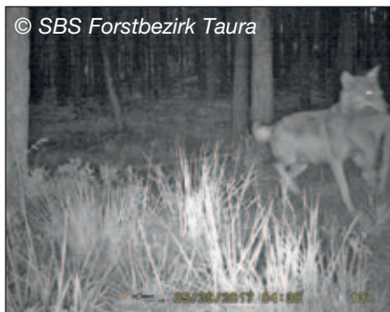
Die Wolfsfähe in der Dahleiner Heide trägt Futter im Maul. Bei ihr ist deutlich ein Gesäuge zu erkennen.

In der Dahleiner Heide (LK Nordsachsen) konnte ein Wolfsrudel nachgewiesen werden. Bereits seit Jahresbeginn gab es einzelne Hinweise auf Wölfe in diesem Gebiet. Ende Mai wurde eine Wolfsfähe mit Gesäuge, welche Futter im Maul trug, von einer Fotofalle fotografiert (s. li. Foto). Aktuell wurden zwei Welpen beobachtet und fotografiert. In neun weiteren sächsischen Wolfsterritorien konnte ebenfalls bereits Reproduktion nachgewiesen werden. In den Territorien des Daubitzer, Königshainer Berge, Nieskyer, Rosenthaler und Seenland Rudels gibt es Fotoaufnahmen von Welpen. Auch bei dem im Monitoringjahr 2015/ 2016 neu etablierten Wolfspaar in der Neustädter Heide (LK Bautzen) wurde erstmals Nachwuchs bestätigt. Außerdem liegen aus dem Daubaner, Nochtener und Knappenrode Rudel Hinweise auf Reproduktion aufgrund von Fotofallaufnahmen einer Wolfsfähe mit Gesäuge vor.