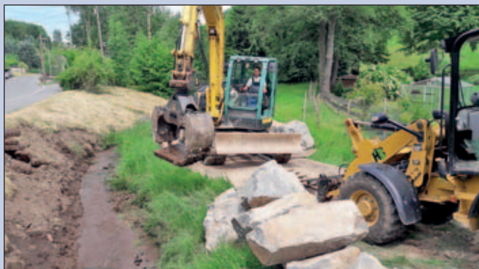
Bereich Brücke Zethau 150